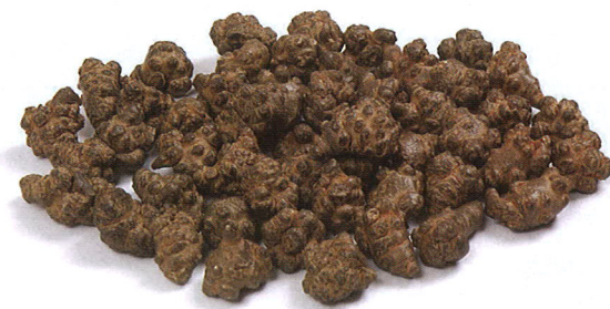
† 田七加玫瑰花可治肝鬱血瘀型。